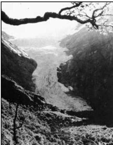
Briksdalsbreen — en arm av Jostedalsbreen.

S TUDIEOMRÅDET er en av landets mest besøkte naturattraksjoner, med ca. 140.000 besøkende i 1990. Besøket har vært økende i de senere år og preges av en stor andel utenlandske og organiserte reisende.