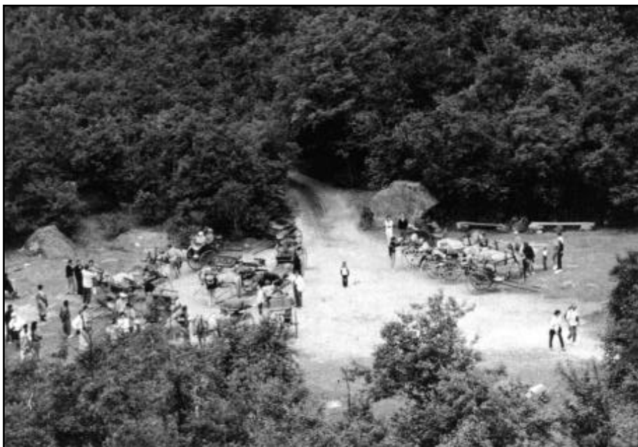
Fra hestesnuplassen. Bildet er tatt nedover dalen.